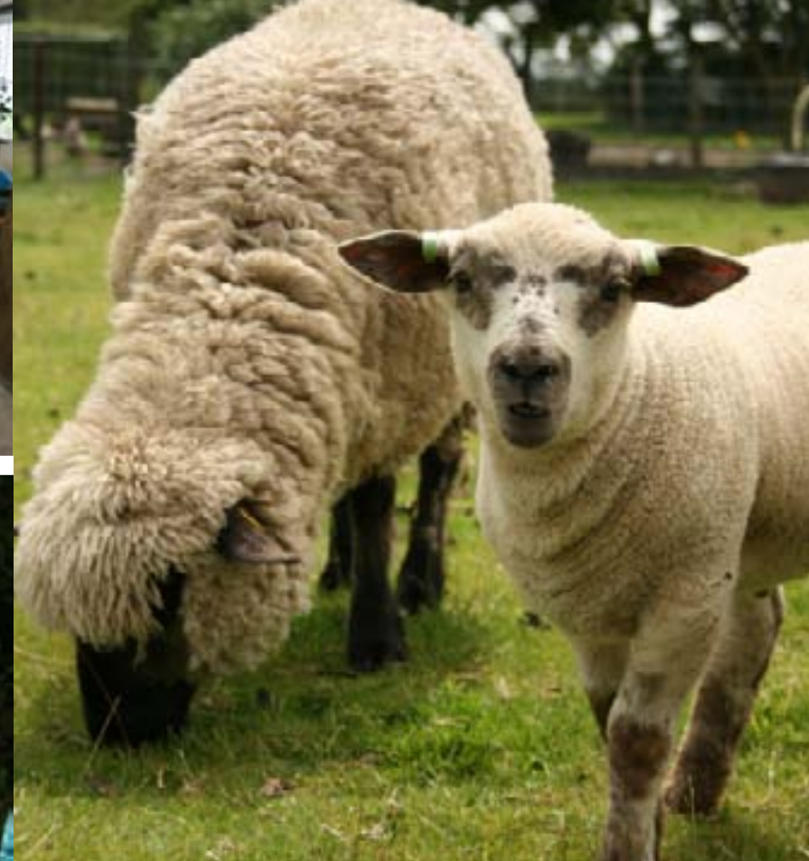
Links: Moeder en kind van het ras Hampshire Down, een van de dertig rassen op schapenboerderij Rozenhout. Rechtsboven: Een traditionele schapenschaar. Onder: Op elke rol staat een korte beschrijving van het type vacht.